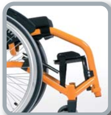
Reposapiés con placa de aluminio (kids)