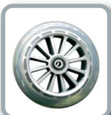
Ruedas 5" translúcidas