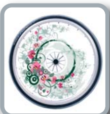
Protector para radios B85 M1 "Flores"