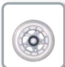
Ruedas 3" translúcidas