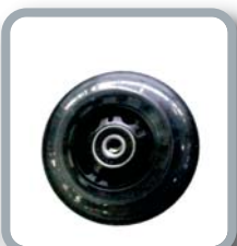
Ruedas 3" negras