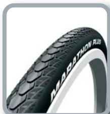
Schwalbe Marathon Plus Evolution