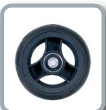
Ruedas 4" negras