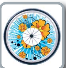
Protector para radios B85 M2 "Flores"