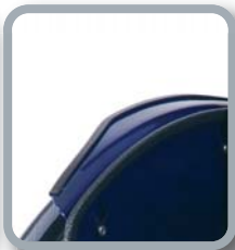
Protector de ropa B82