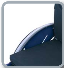
Protector de ropa B82S