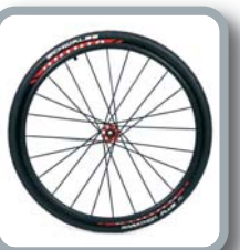
Ruedas 24" Viking