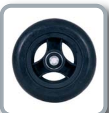
Ruedas 5" negras