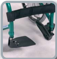
Reposapiés con paletas separadas