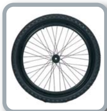
Ruedas 24" Off Road