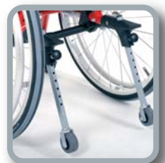
B78 - Posibilidad de montar un sistema de protección antivuelco