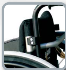
Empuñaduras de altura regulable