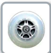
Ruedas 4" translúcidas