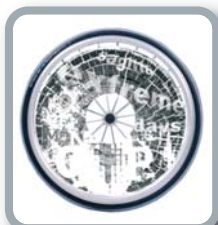
Protector para radios B85 M3 "Extremo"