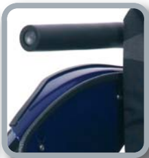
Protector de ropa B82 + tubo