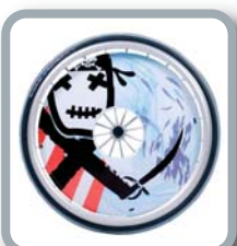
Protector para radios B85 M4 "Pirata"