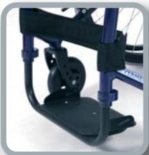
Reposapiés monobloc con chapa de aluminio