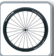
Ruedas 24" Spinergy