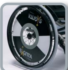
Protector para radios B85 logo Sagitta