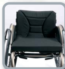
B23 - Cojín del asiento