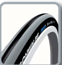
Schwalbe Right Run