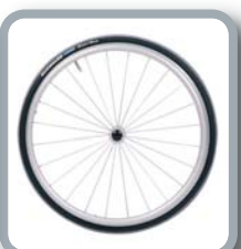
Protector para radios B85 (transparente)