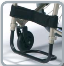
Reposapiés monobloc de tubo redondo