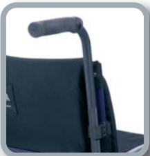
Empuñaduras regulables en altura